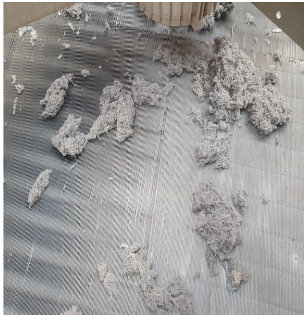
Dissipatori prima e dopo il nostro intervento.

Sede Amministrativa Via G. Marconi, 24 – 20071 Vermezzo con Zelo (MI) Sede Legale P.le. Delle Bande Nere, 7 – 20146 Milano Info@tecnomgl.com – Tel. 02.36543553 P.IVA e CF. 11563350963