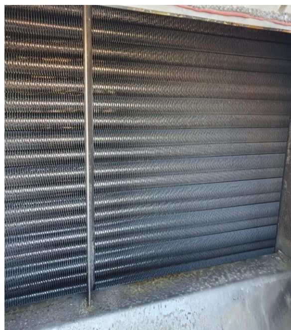
Caldaie a tubi alettati prima e dopo il nostro intervento.