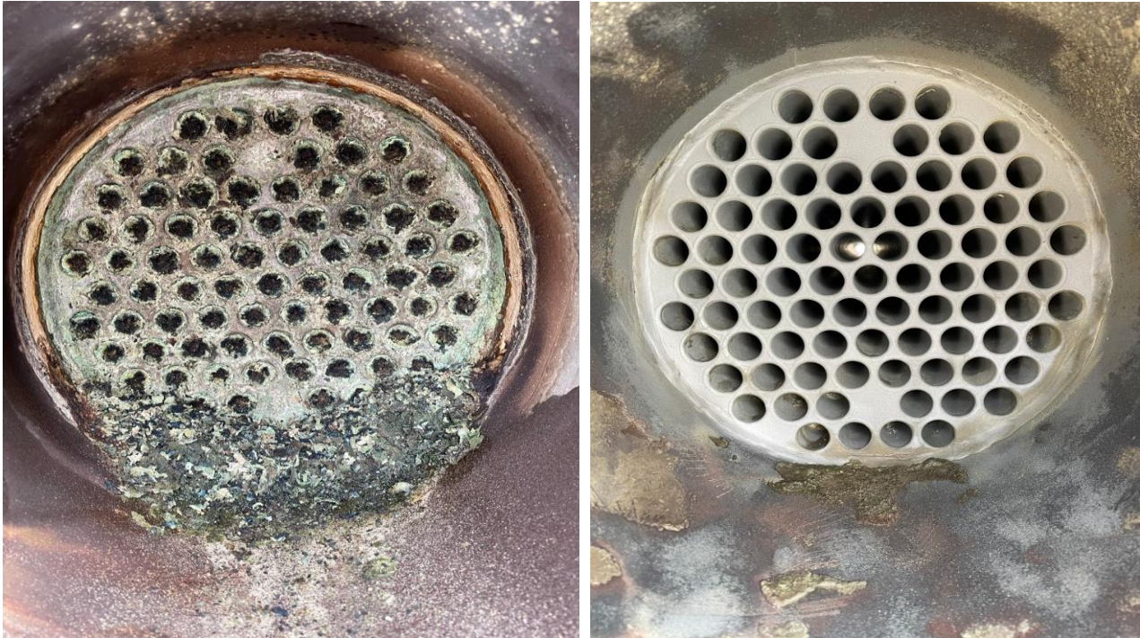
Scambiatori di calore a fascio tubiero prima e dopo il nostro intervento.