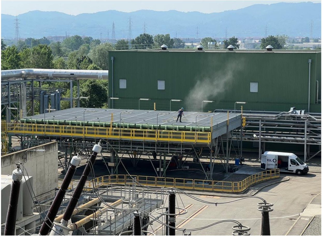
Pulitura Aircooler ciclo chiuso